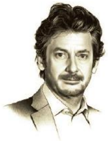
Monsieur le Français, Créateur à l'origine de l'univers Maison Close. Founder and creator of Maison Close.

Maison Close Больше чем бренд, это философия.