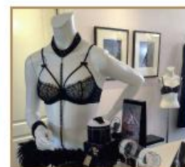
Kant Amsterdam, The Netherlands