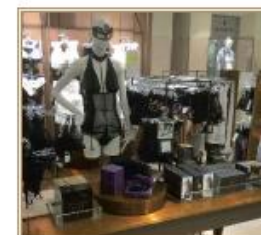
KaDeWe Berlin, Germany