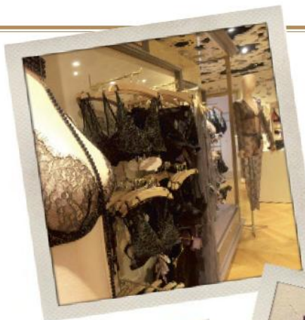
Galeries Lafayette Paris