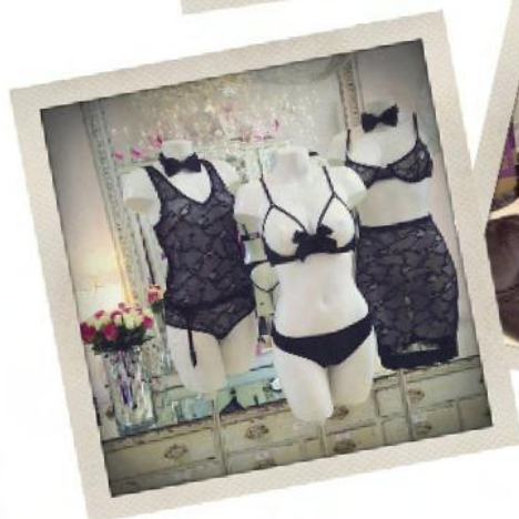
Faire Frou Frou Los Angeles