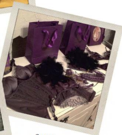
Sugar Cookies New York