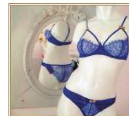
Faire Frou Frou Los Angeles, USA