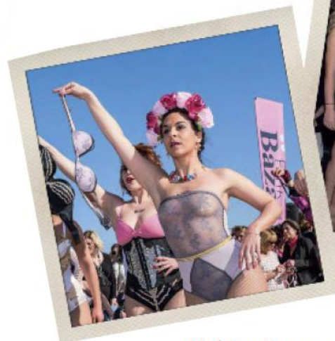
Pink Bra Bazaar Paris