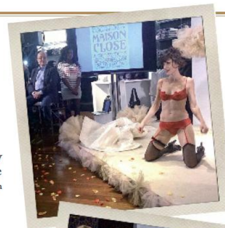
Valentine's day Galeries Lafayette Berlin