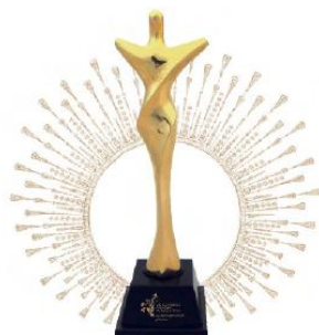
Maison Close élue Boudoir Brand of the Year aux UK Lingerie Awards. Maison Close voted Boudoir Brand of the Year at the UK Lingerie Awards.