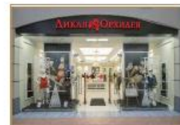
Wild Orchid Moscow, Russia